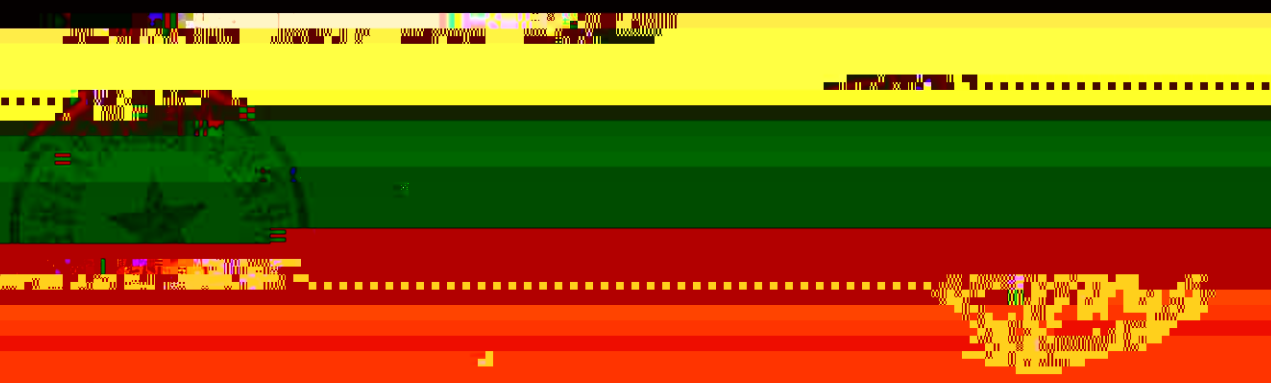
图 1-1 建设期限

1.1 建设期限 1.1.1 建设期限 1.1.2 建设期限 1.1.3 建设期限 1.1.4 建设期限 1.1.5 建设期限 1.1.6 建设期限 1.1.7 建设期限 1.1.8 建设期限 1.1.9 建设期限 1.1.10 建设期限 1.1.11 建设期限 1.1.12 建设期限 1.1.13 建设期限 1.1.14 建设期限 1.1.15 建设期限 1.1.16 建设期限 1.1.17 建设期限 1.1.18 建设期限 1.1.19 建设期限 1.1.20 建设期限 1.1.21 建设期限 1.1.22 建设期限 1.1.23 建设期限 1.1.24 建设期限 1.1.25 建设期限 1.1.26 建设期限 1.1.27 建设期限 1.1.28 建设期限 1.1.29 建设期限 1.1.30 建设期限 1.1.31 建设期限 1.1.32 建设期限 1.1.33 建设期限 1.1.34 建设期限 1.1.35 建设期限 1.1.36 建设期限 1.1.37 建设期限 1.1.38 建设期限 1.1.39 建设期限 1.1.40 建设期限 1.1.41 建设期限 1.1.42 建设期限 1.1.43 建设期限 1.1.44 建设期限 1.1.45 建设期限 1.1.46 建设期限 1.1.47 建设期限 1.1.48 建设期限 1.1.49 建设期限 1.1.50 建设期限 1.1.51 建设期限 1.1.52 建设期限 1.1.53 建设期限 1.1.54 建设期限 1.1.55 建设期限 1.1.56 建设期限 1.1.57 建设期限 1.1.58 建设期限 1.1.59 建设期限 1.1.60 建设期限 1.1.61 建设期限 1.1.62 建设期限 1.1.63 建设期限 1.1.64 建设期限 1.1.65 建设期限 1.1.66 建设期限 1.1.67 建设期限 1.1.68 建设期限 1.1.69 建设期限 1.1.70 建设期限 1.1.71 建设期限 1.1.72 建设期限 1.1.73 建设期限 1.1.74 建设期限 1.1.75 建设期限 1.1.76 建设期限 1.1.77 建设期限 1.1.78 建设期限 1.1.79 建设期限 1.1.80 建设期限 1.1.81 建设期限 1.1.82 建设期限 1.1.83 建设期限 1.1.84 建设期限 1.1.85 建设期限 1.1.86 建设期限 1.1.87 建设期限 1.1.88 建设期限 1.1.89 建设期限 1.1.90 建设期限 1.1.91 建设期限 1.1.92 建设期限 1.1.93 建设期限 1.1.94 建设期限 1.1.95 建设期限 1.1.96 建设期限 1.1.97 建设期限 1.1.98 建设期限 1.1.99 建设期限 1.1.100 建设期限